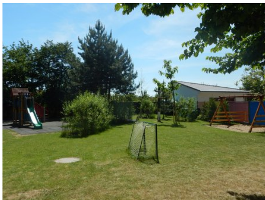
dětské hřiště v MŠ

Mimo dětského hřiště u základní školy nejdeme v obci i další dětská hřiště. Již zmiňovaná v areálech MŠ a školní družiny. Tato dvě hřiště jsou v dobrém technickém stavu, protože prochází z logických důvodů pravidelnými kontrolami. Další hřiště se nachází za budovou bývalého zámku a v ulici Pod Hospodou.