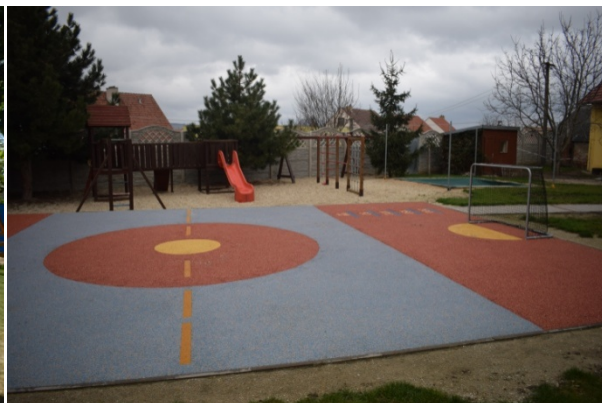
hřiště ve školní družině