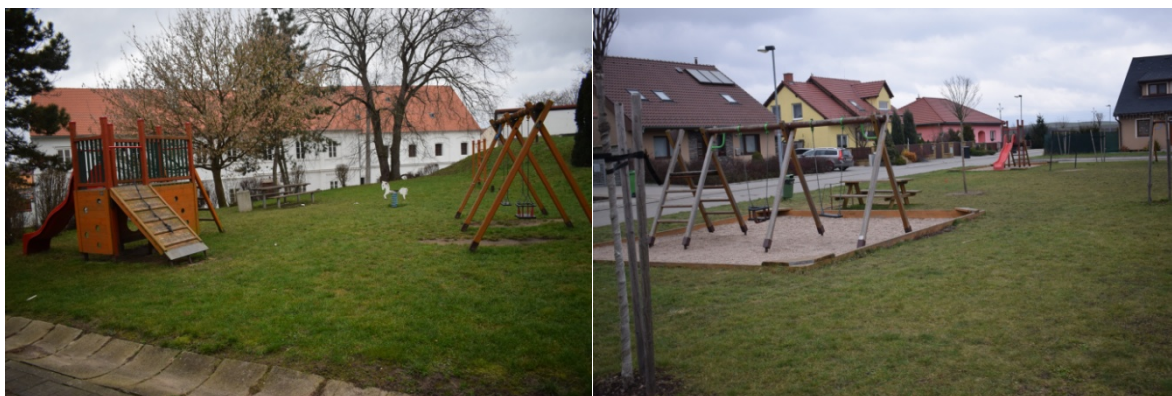
dětské hřiště za budovou zámku